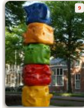
9 Totemetot | Frank Koolen

Kijk eens om je heen. Wat zie je als je langer kijkt? Het figuurtje kijkt vol bewondering naar de wereldbol en wil ons laten zien dat je bewust met de aarde moet omgaan.