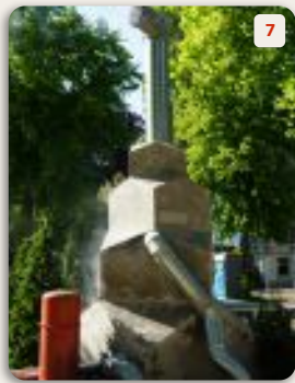
7 Powerplant | Leonard van Munster

Lachgas lijkt zo leuk, de lol is kort maar bij veelvuldig gebruik kun je er ernstige schade aan overhouden. Met een berg op straat gevonden lachgaspatronen maakte André Pielage een contrastrijk kunstwerk van stoer staal en klassieke festoenen. Als poëzie, aldus de kunstenaar.