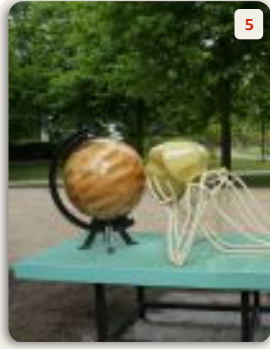
5 In Awe | Pieter W Postma

Het lijkt net een technisch gemanipuleerde boom. Alsof de wielen ieder moment kunnen gaan draaien om de grondstoffen weer terug aan de natuur te geven. De gietijzeren wielen komen uit de Limburgse mijnen. Natuur, techniek of een mix? Kies maar, vindt Willem Harbers.